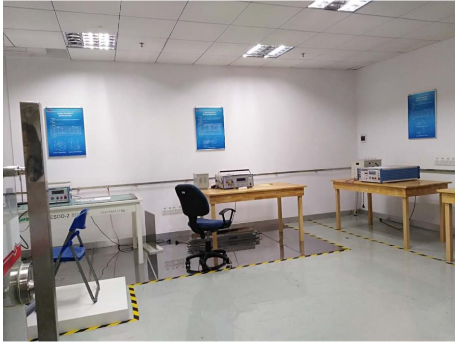
图3 电表性能检验设备